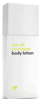
BODY LOTION lait corps