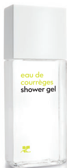
SHOWER GEL gel douche