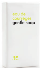
SOAP savon 1.41 oz / 40 g